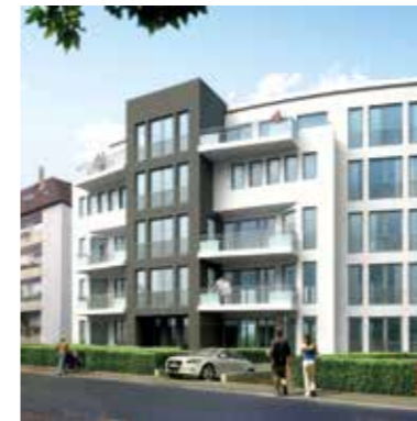
Neubau oder Bestand